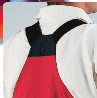
Elastisch gedeelte aan de achterzijde geeft extra comfort.